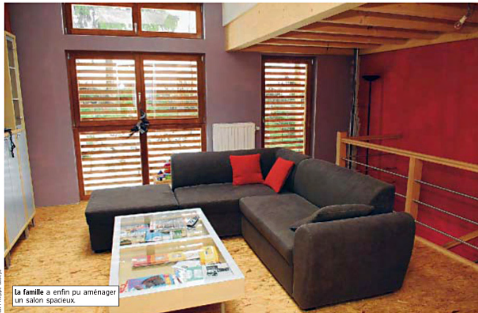
La famille a enfin pu aménager un salon spacieux.

L'architecte ne peut pas encore chiffrer la consommation de l'annexe, construite récemment. Il a opté pour un vitrage performant et veillé à l'étanchéité à l'air. Dans la partie d'origine, de nombreux travaux sont prévus pour améliorer les capacités énergétiques. La mitoyenneté diminue déjà la consommation d'énergie.